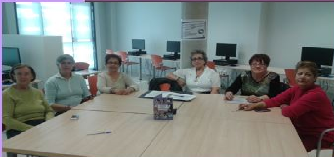
Charla- coloquio on-line sobre igualdad de Genero, dirigida a Todos los centros municipales de mayores de Madrid.