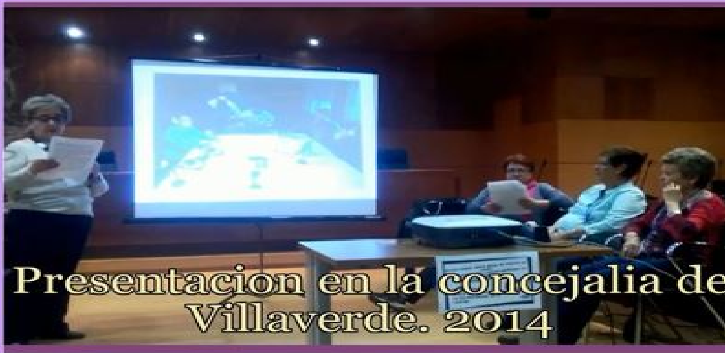
Presentacion en lá concejalia de Villaverde. 2014